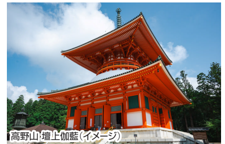
高野山 壇上伽藍(イメージ)