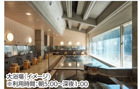
大浴場(イメージ) ※利用時間: 朝5:00~深夜1:00