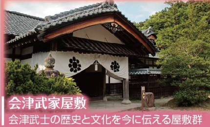
会津武家屋敷 会津武士の歴史と文化を今に伝える屋敷群