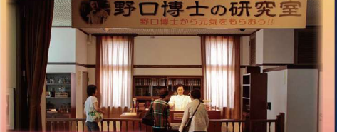
野口英世記念館 世界的医学者の足跡と功績にふれる記念館