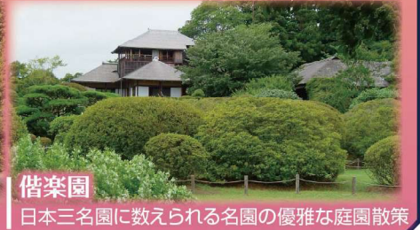
借楽園 日本三名園に数えられる名園の優雅な庭園散策