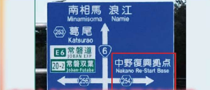
東日本大震災・原子力災害伝承館 震災の記憶と復興の歩みを伝える伝承施設