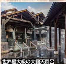
世界最大級の大露天風呂