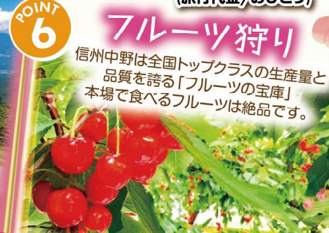
POINT 6 フルーツ狩り 信州中野は全国トップクラスの生産量と 品質を誇る「フルーツの宝庫」 本場で食べるフルーツは絶品です。