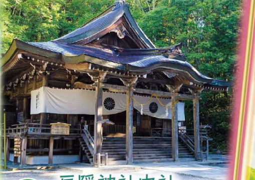
POINT 5 戸隠神社中社 5つの戸隠神社のうち中心「中社」 樹齢800年を超える三本杉が有名です