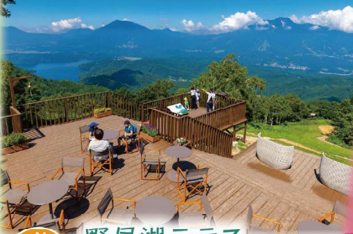
POINT 4 野尻湖テラス 晴れの日には野尻湖や北信五岳の 素晴らしい景色が楽しめます。