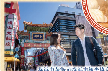
横浜中華街