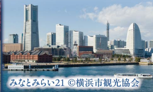
みなとみらい21