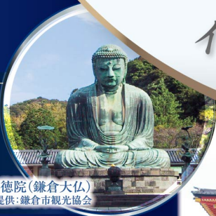
高德院(鎌倉大仏)

海に浮かぶヨットの白い帆をイメージした外観が印象的なホテル。 みなとみらいの景色と上質な滞在を楽しめます。 ホテルは横浜港に面した近代的なエリア 「みなとみらい」に位置して、ホテル周辺にはショッピング、 グルメ施設が連なります。また、赤レンガ倉庫も徒歩圏内です。