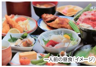
一人前の昼食(イメージ)