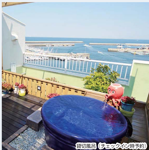
貸切風呂(チェックイン時予約)