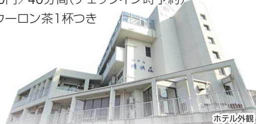
掲載の写真はすべてイメージです。