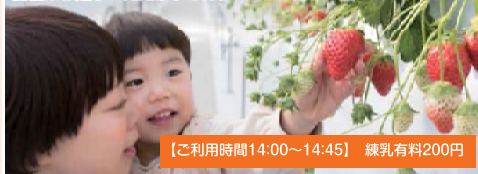
【ご利用時間14:00~14:45】 練乳有料200円

えびせんべいの里の向かいにある山笑う里いちご農園にて45分間のいちご狩り体験! 産地: 紅ほっぺ、よつぼし、おいCベリーの4品種を育てています。品種はお選びいただけません。