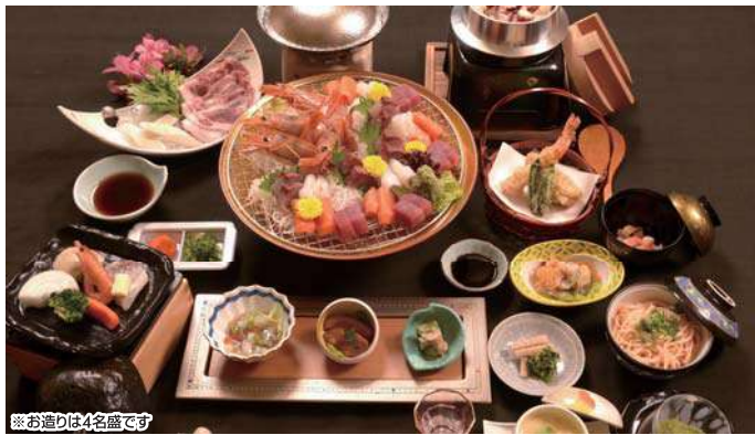
※お造りは4名盛です