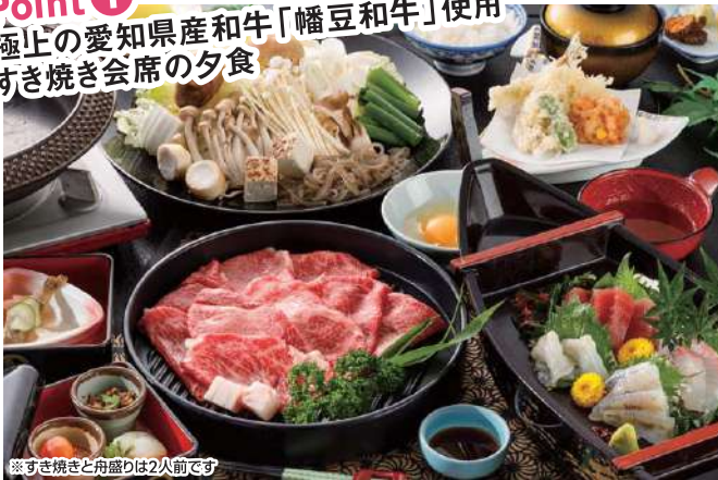
※すき焼きと舟盛りは2人前です (掲載の写真はすべてイメージです)