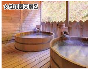
(掲載の写真はすべてイメージです)