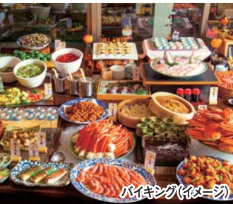
バイキング(イメージ)