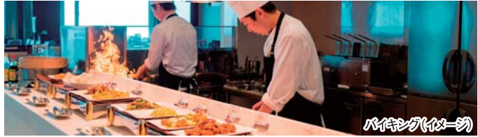
バイキング(イメージ)