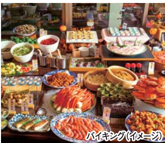
バイキング(イメージ)