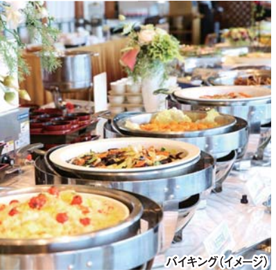
バイキング(イメージ)