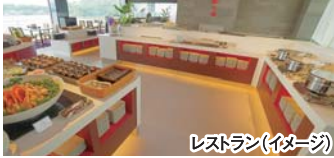
レストラン(イメージ)