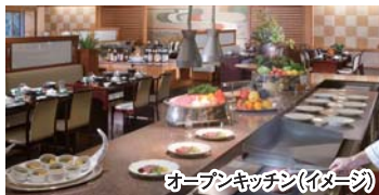
オープンキッチン(イメージ)