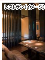
レストラン(イメージ)