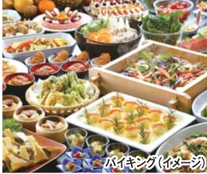
バイキング(イメージ)