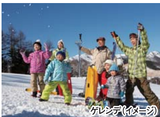
ゲレンデ(イメージ)