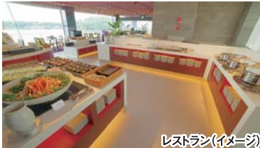
レストラン(イメージ)