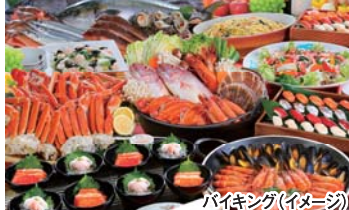
バイキング(イメージ)