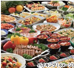
バイキング(イメージ)