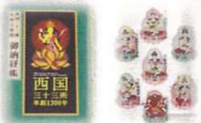
表装生地イメージ(二丁上遠州)