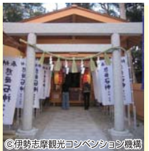
※写真はすべてイメージです。