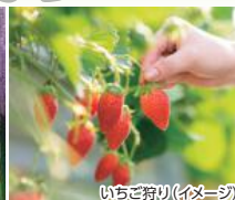
はままつフラワーパーク(イメージ)