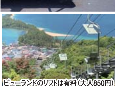
ビューランドのリフトは有料(大人850円)