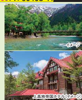
上高地帝国ホテル(イメージ)