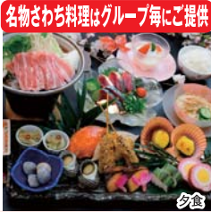
名物さわり料理はグループ毎にご提供