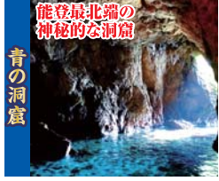
能登最北端の神秘的な洞窟