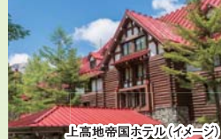
上高地帝国ホテル(イメージ)