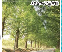
メタセコイア並木道