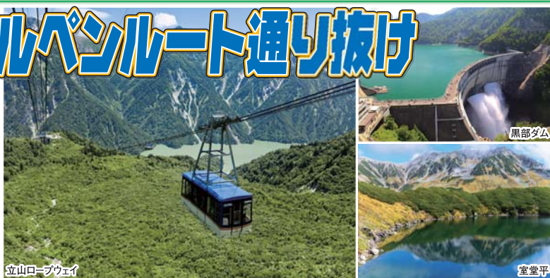
立山ロープウェイ