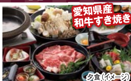
愛知県産 和牛すき焼き 夕食(1夜)

セット内容 ・1泊2食付宿泊代・アサリ釜めしランチ ・4月はいちご狩り・6~8月はメロン狩り ・魚市場のおやつ