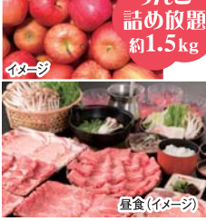
りんご詰め放題 約1.5kg

コース (戸田7:30・名古屋8:20)~(3才~大小共通料金) 光前寺~駒ヶ根(3種肉しゃぶなど食べ放題) (昼食・いちご狩り・りんご) かんてんばはガーデン(お買物)~伊那(いちご狩り食べ放題)~飯田(りんご詰め放題約1.5kg)~(名古屋18:00・戸田18:30) ※写真は全てイメージです