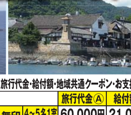
尾道・千光寺公園