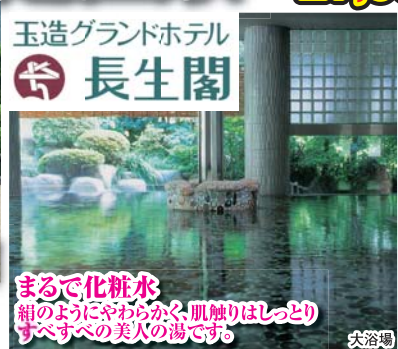
玉造グランドホテル 長生閣 まるで化粧水 箱のようにやわらかく肌触りはしっとり すべすべの美人の湯です。