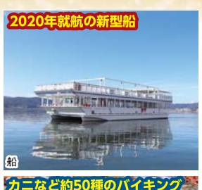
2020年就航の新型船 カニなど約50種のバイキング アルコール飲み放題付