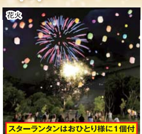
スターランタンはおひとり様に1個付