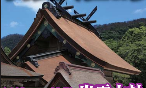
縁結びの神様 出雲大社

お支払い実額(おひとり様) 22,100円~ 27,000円 G-5(1泊) 68307-20 島根県 広島県 大分県 福岡県