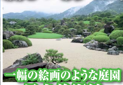
一幅の絵画のような庭園 足立美術館