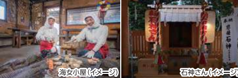
海女小屋(イメージ)