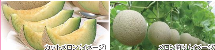
カットメロン(イメージ)