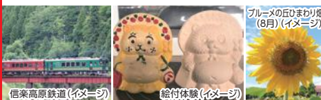
信楽高原鉄道(イメージ)