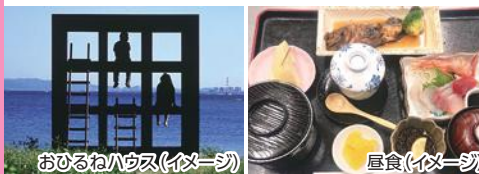
おひるねハウス(イメージ)