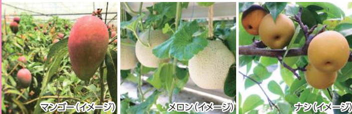
マンゴー(イメージ)