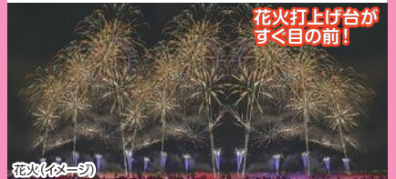
花火打上げ台がすぐ目の前!