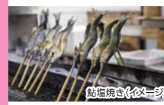
鮎焼焼き(イメージ)