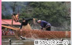
昼うかい(イメージ)