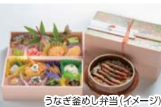
うなぎ釜めし弁当(イメージ)