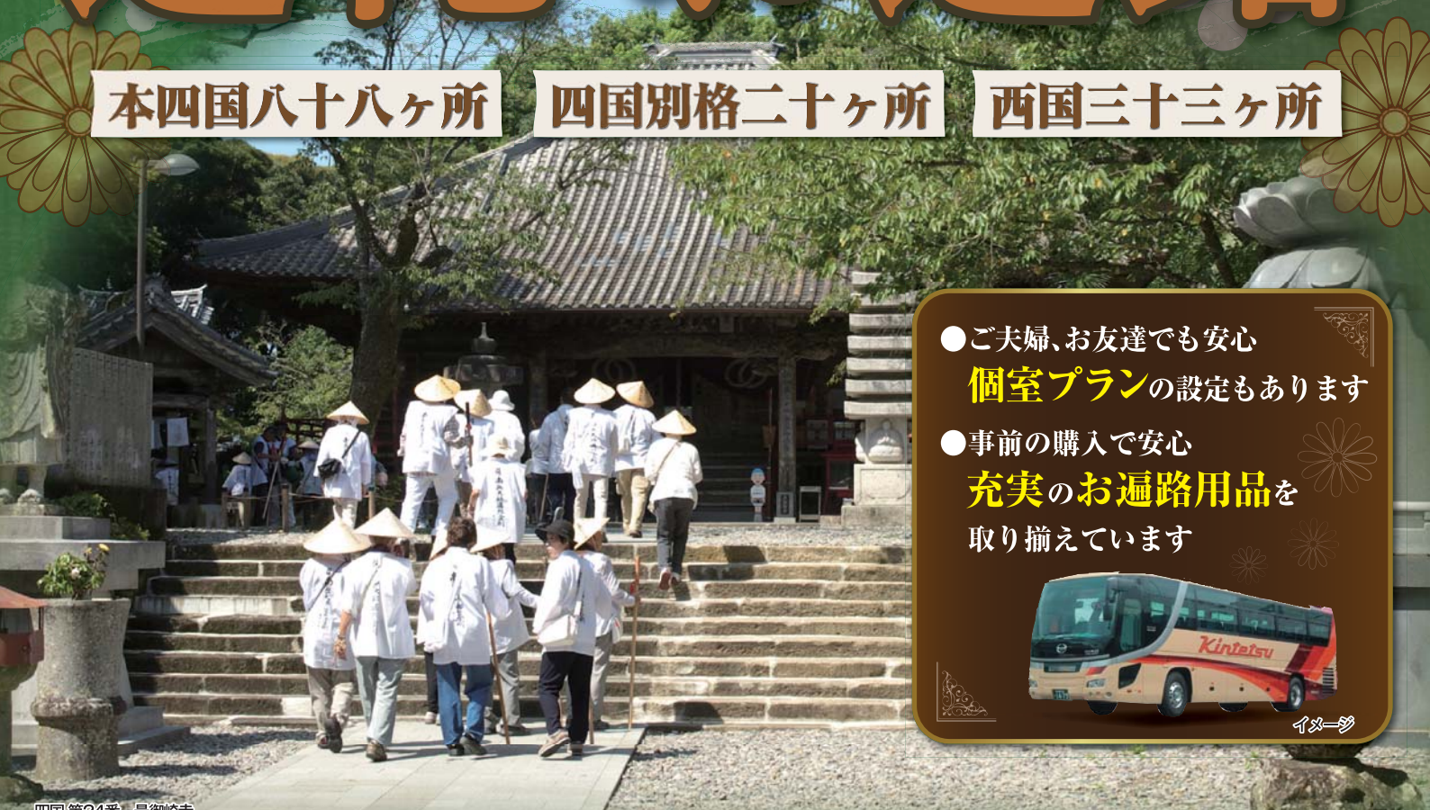
四国第24番 最御崎寺