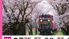
嵯峨野トロッコ列車

A-54 (日帰り) 3/31まで 71720-01 (日帰り) 4/1から 61006-10 出発日 3月16・21・22・24・27・29・30 4月2・3・4・8・12・14・16・20・25・28・30 5月2・4・6・10・16・18・24・30 (マークは出発決定日) 旅行代金(おひとり様) 無印 8,500円 印 8,980円 (4才~小学生1,500円引) (昼食・船・トロッコ) コース (戸田7:30・名古屋8:20) ~ 八つ橋専門店・おたべ ~ 屋形船 船頭が竿一本で遊覧... 嵐山 おばんざいバイキングの昼食 竹林の道や縁結びの神社など自由散策... 嵐山駅 ~ 嵯峨野トロッコ列車 ~ 亀岡駅 ~ (戸田19:00・名古屋19:30)