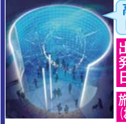
※写真は全てイメージです

A-57 (日帰り) 60040-10 高さ7mのスクリーンシアターで 「スーパーカミオカンデ」の研究内容を紹介 出発日 5月14・17・20・30 6月3・7・10・13・25・28 7月1・4 旅行代金(おひとり様) (小人300円引) (昼食・食べ歩き) 7,980円 コース (戸田7:30・名古屋8:20) ~ 飛騨 地物づくり 在郷料理の昼食... 飛騨古川 白壁土蔵街 ~ 酒蔵など散策 飛騨牛コロッケ 食べ歩き ~ スカイドーム神岡 カミオカラボの見学 ~ 古川農産物 直売所 ~ (名古屋18:20・戸田18:50)