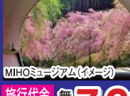
MIHOミュージアム(イメージ)

A-49 (日帰り) 61018-10 13万本チューリップと 50種バイキング 出発日 (マークは出発決定日) 4月6・10・12・14・18・20・24 旅行代金(おひとり様) 無印 7,980円 印 8,480円 コース (小学生1,600円引, 3才~幼児2,300円引) (昼食・入場料) (戸田7:30・名古屋8:20) ~ ブルメの丘 (13万本のチューリップ&まっ黄色な菜の花畑) 約50種類旬菜バイキングの昼食 ~ MIHOミュージアム トンネルからのしだれ桜と美術館見学 ~ 信楽陶苑たぬき村 ~ (戸田17:50・名古屋18:20)